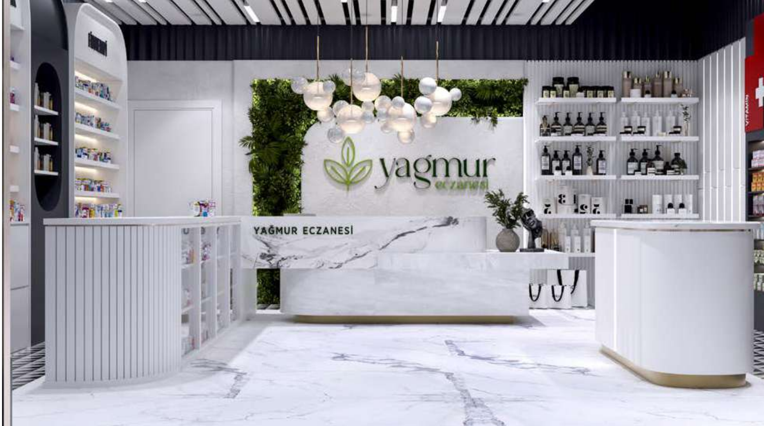
Yağmur Eczanesi Ankara