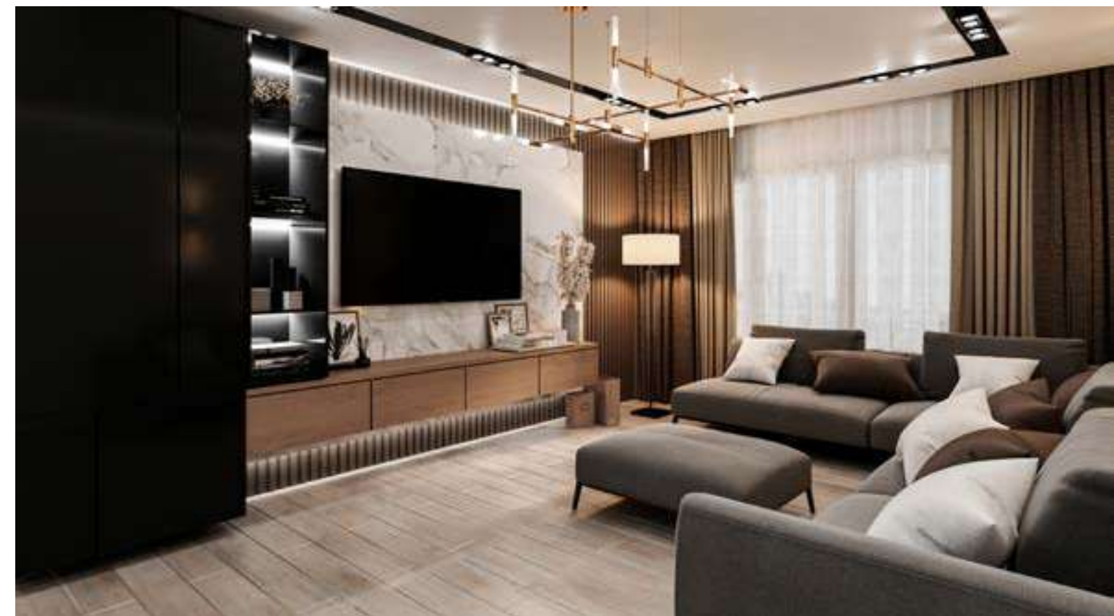
Zirkon Residence Ankara