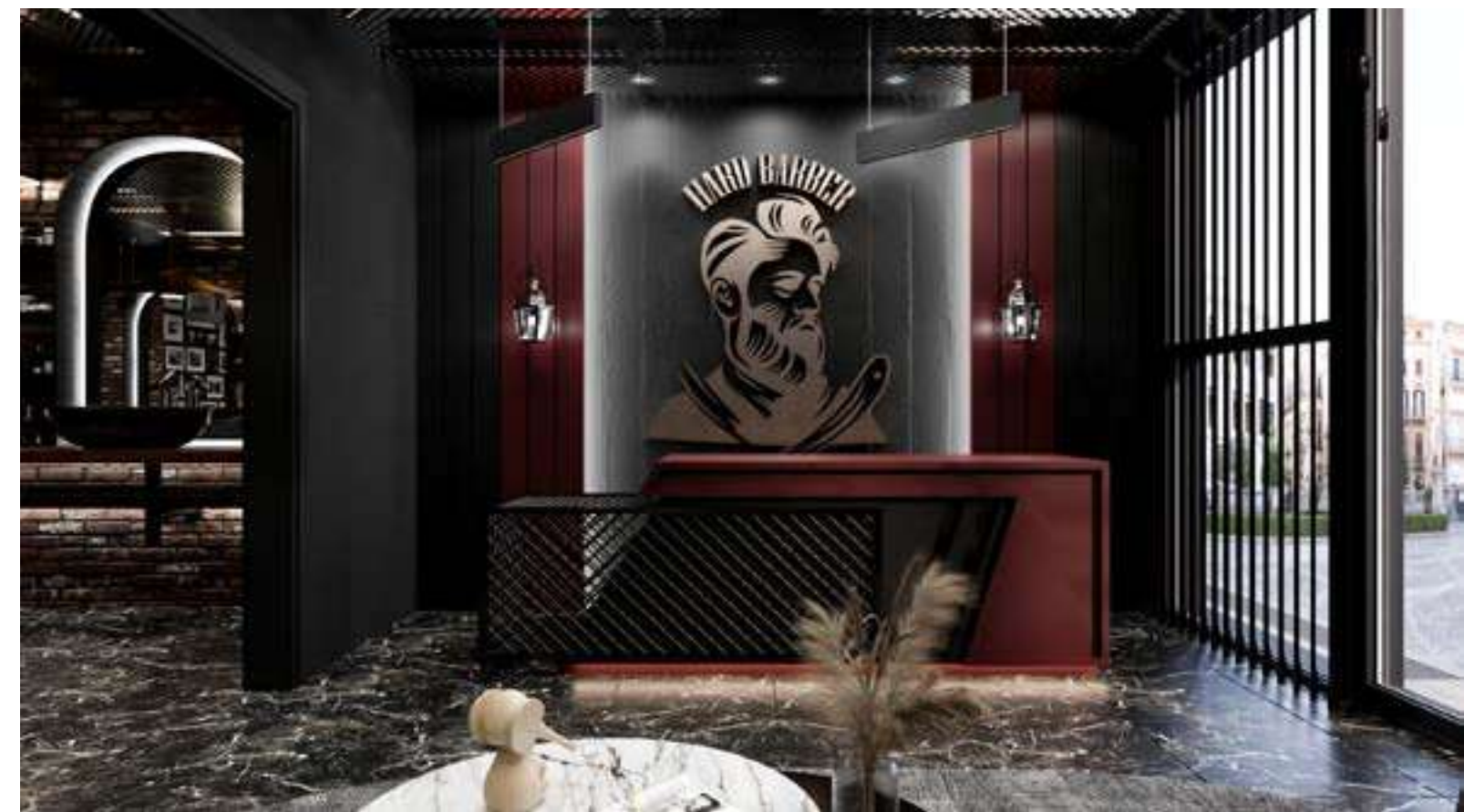
Hard Barber Salonu Almanya