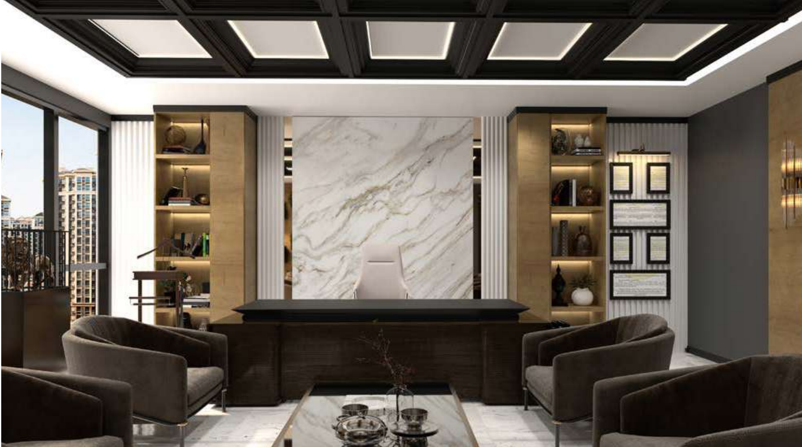
GKZ Avukatlık & Danışmanlık Ankara