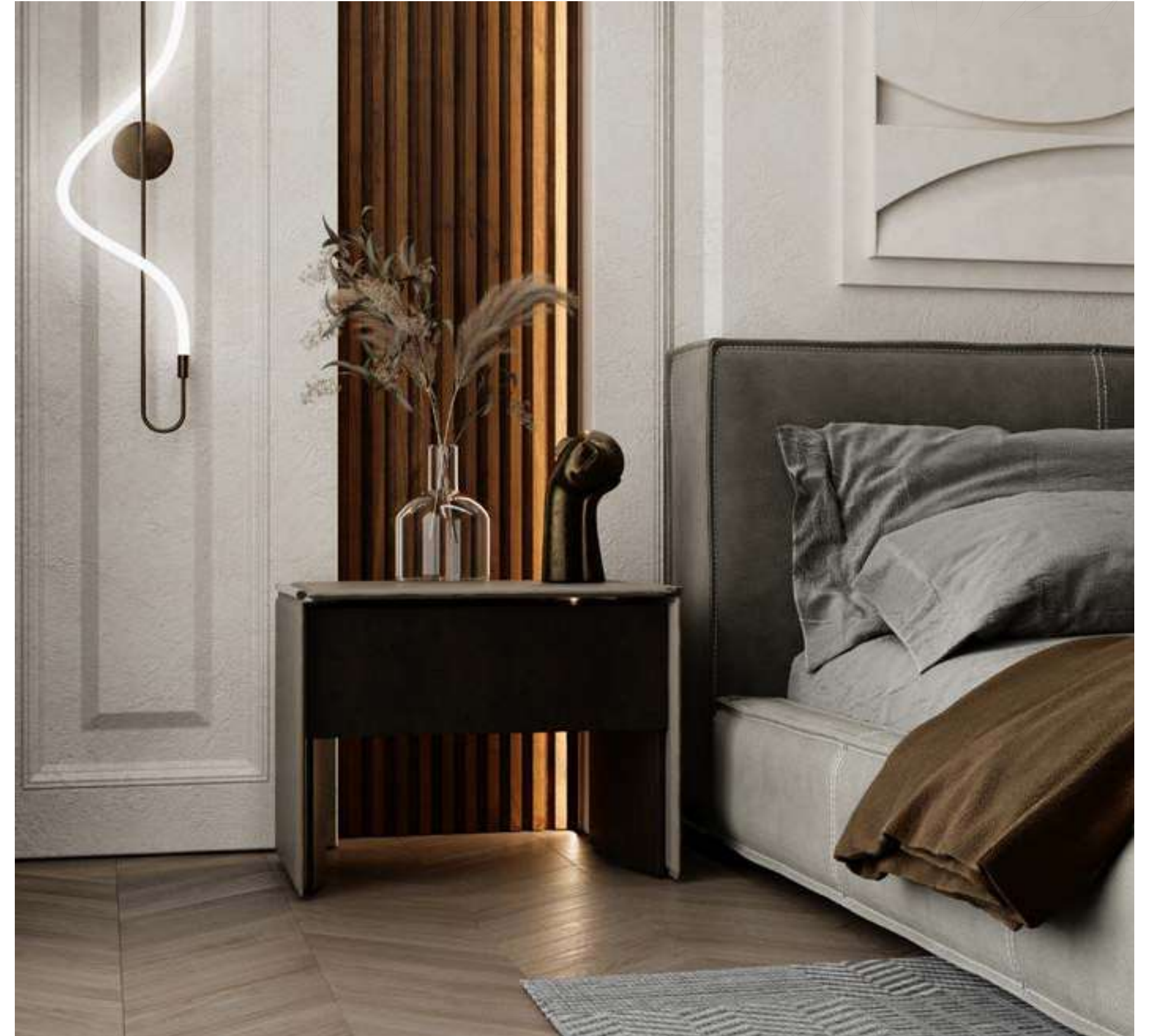
Enlife Konutları Konutları Karaman

Yatak odaları , insanları bir sonraki gün için hazırlayan ve dinlenerek yenilenmelerini sağlayan kısımlardır. Her açıdan sağlığa uygun oda şartları olmalı ve kullanılan mobilyaları da yine ergonomik kullanıma uygun seçilmiş olmalıdır. Her odaya ait mobilyaların doğru yerleştirilmesi, odanın daha geniş, kullanıma elverişli hale gelmesini sağlamaktadır. Aynı şartların yatak odaları için de geçerli olduğunu bilmekteyiz. Yatak odası modellerinin başlıca parçalarının odanın şekline uygun ve en doğru yerlere yerleştirilmesi gerekmektedir.