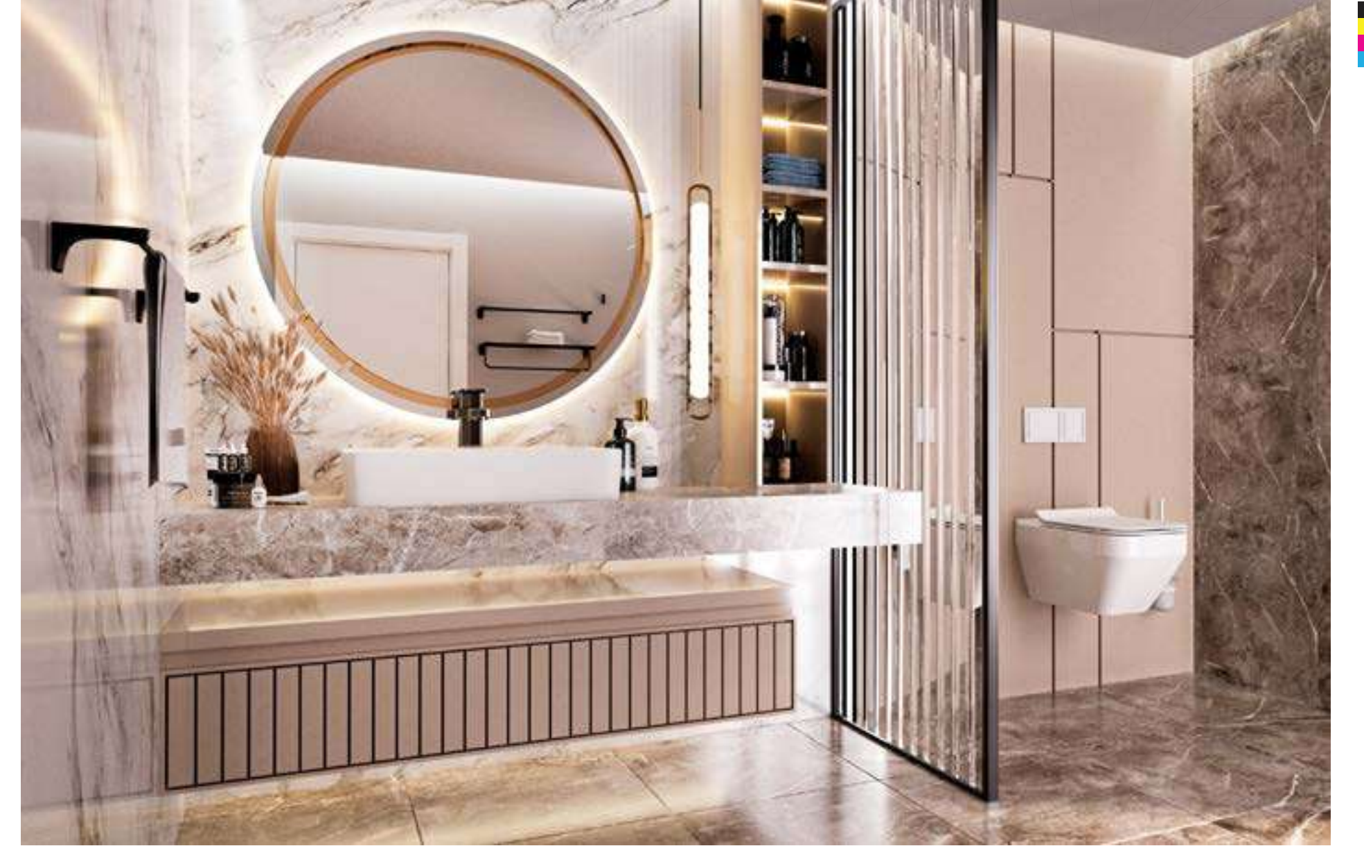
Lyra Konutları Karaman