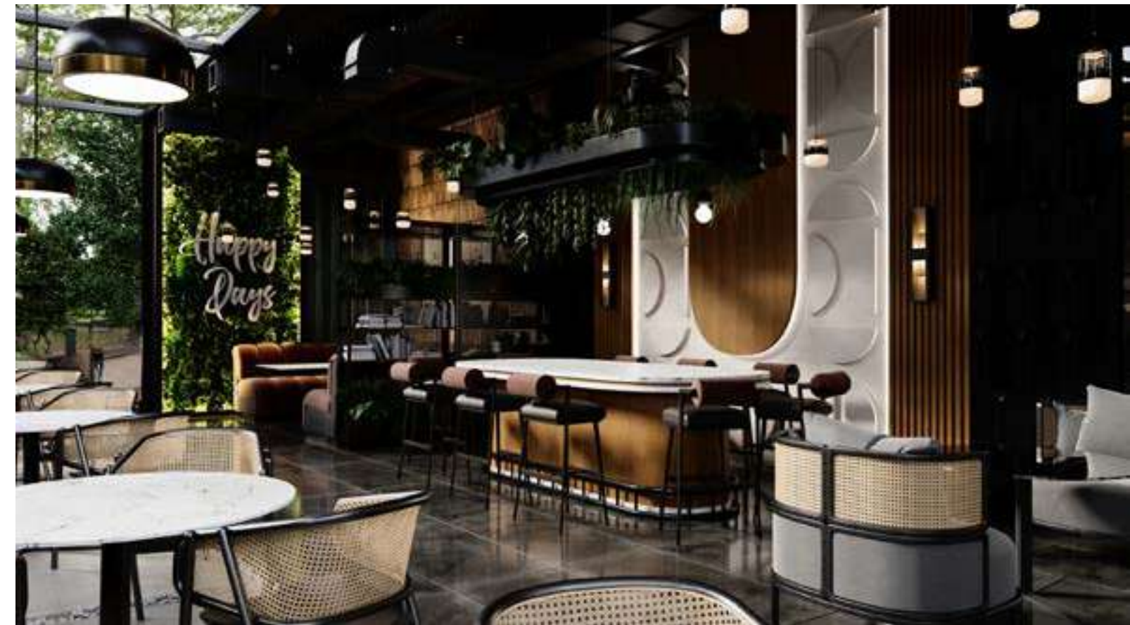
Peet's Coffee Almanya