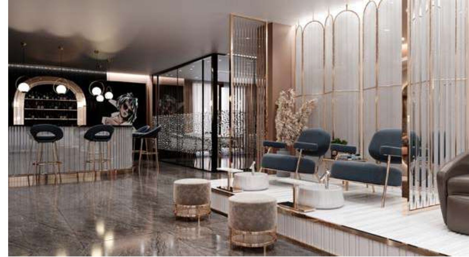
LADY Güzellik Salonu Hollanda