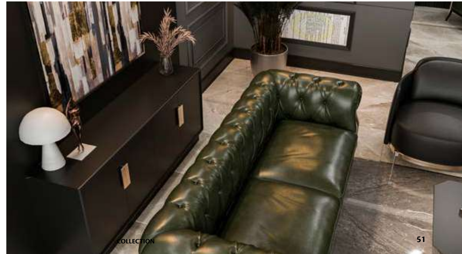
GKZ Avukatlık & Danışmanlık Ankara