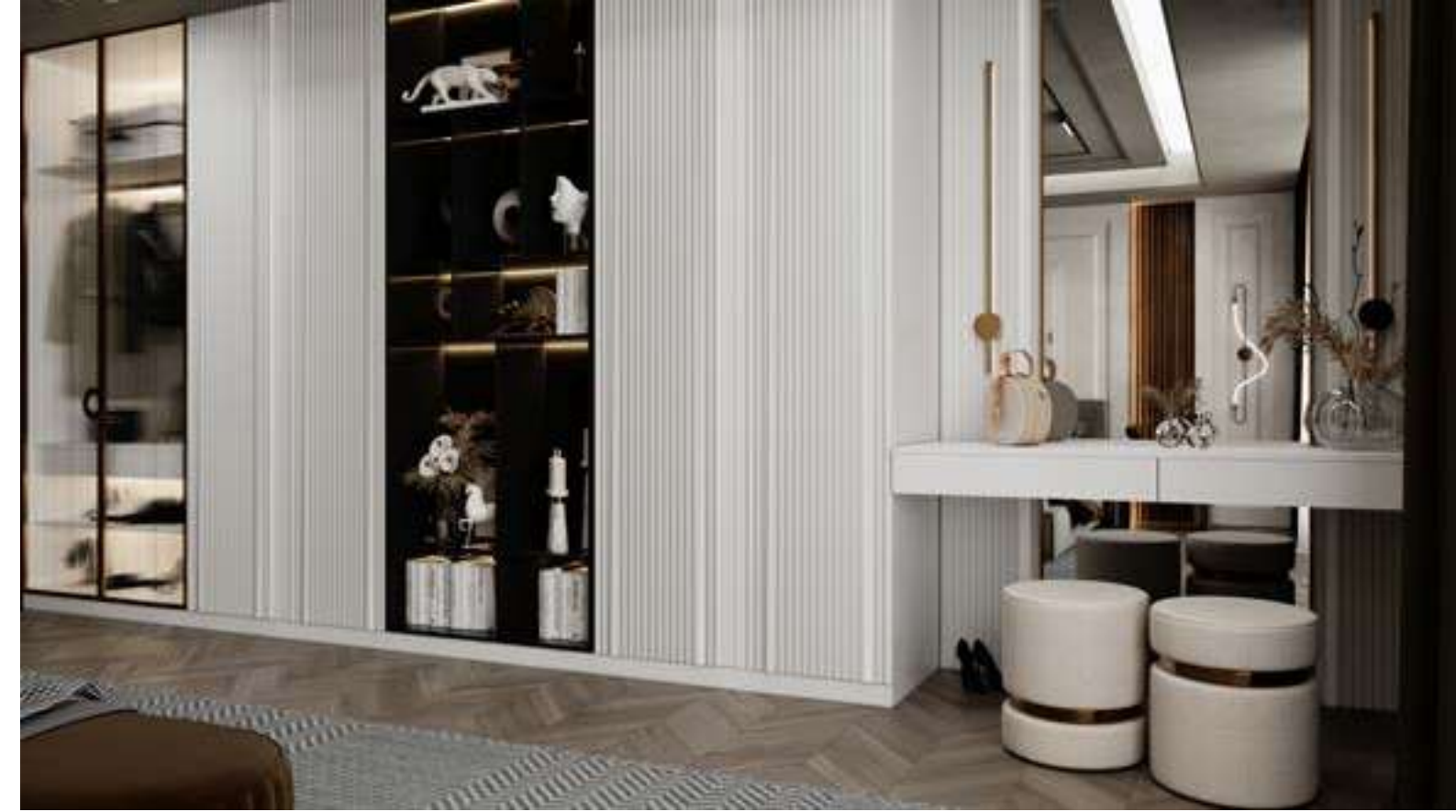
A.Şimşek Konutları Karaman